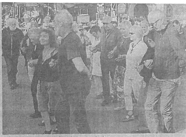
Les visiteurs ont esquissé quelques pas de danse.