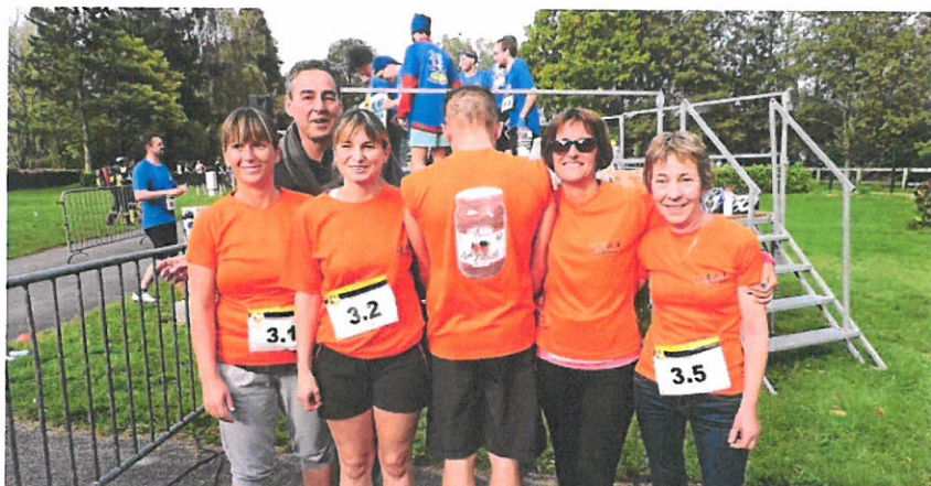
Les Quatre-Saisons, entreprise locale de Locmaria-Berrien, a participé, une fois de plus, au Trophée.

Vendredi, sous un beau soleil, 68 équipes représentant autant d'entreprises de Bretagne et composées chacune de cinq salariés se sont affrontées à l'occasion du trophée sportif Produit en Bretagne. L'objectif de cette rencontre, mise en place depuis sept ans et qui se déroule depuis trois ans, sur les terres d'Huelgoat, autour du lac, est de favoriser les échanges entre les entreprises membres du premier réseau économique de Bretagne. Celui-ci rassemble plus de 360 entreprises venant de tous les horizons et situées sur les cinq départements bretons.