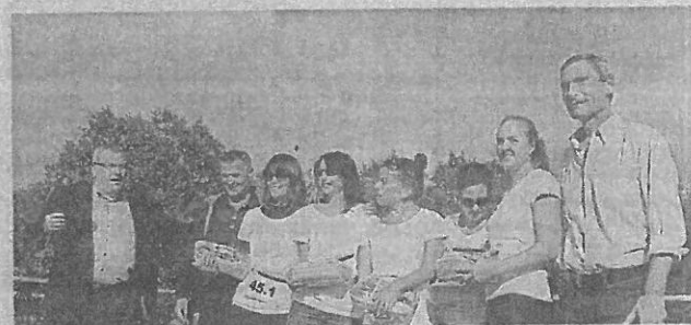
Une fois n'est pas coutume, c'est l'équipe des éditions Fitamant, qui a fini dernière, qui a reçu ses prix la première.

Le jeu de palets qui s'est déroulé en fin de parcours a permis aux équipes de gagner des secondes. La grande gagnante est l'équipe Grand Ouest Etiquettes qui se place à la première place suivie par Trécobat. Altho Bret's a raté la troisième place.