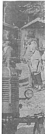
Le travail des sabots de bois avec les machines d'époque.